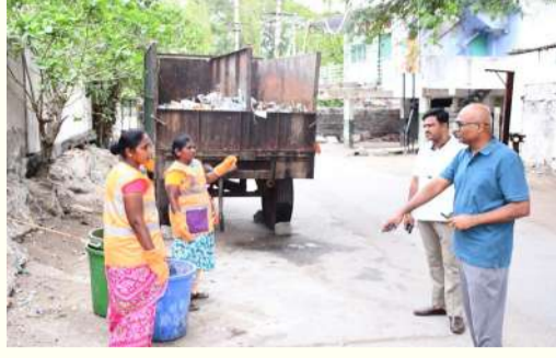
అపరిశుభ్రంగా మారిన మి ఆరోగ్యసైన్ కదా ప్రభావం వరుతుంది, మరోసారి జలాంటి తప్పు చేయవద్దని హితవు పలికారు. ఈ సందర్భంగా కమిషనర్ మాట్లాడుతూ.. నగరంలోని చెత్త ఎక్కువగా పేరుకుపోయే 50 గార్హేజీ వల్లరబుల్ పాయింట్లు (జీవీపీలు) వద్ద సీసీ కెమెరాలు ఏర్పాటు చేసి నిరంతర నిఘా నిర్వహిస్తున్నామని తెలిపారు. ఈ కెమెరాల దృశ్యాలును సంబంధిత