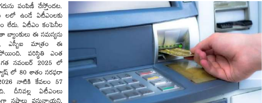
ఏమంటున్నారని నిజానికి దేశంలో చలాచలాలో ఉన్న కరెన్సీ చాలా ఎక్కువగానే ఉంది.

ఉన్న వాటికి ఎక్కువ నగదును పంపిణీ చేస్తుండటం. దీనివల్ల చిన్న పట్టణాల లలో ఉండే ఏటీఎంలకు తగినంత నగదు అందడం లేదు. ఏటీఎం కంపెనీల సీకీటల ప్రకారం.. మిగతా బ్యాంకులు ఈ సమస్యను మేనేజ్ చేస్తున్నప్పటికీ, ఎస్పీజి మాత్రం ఈ విషయంలో వెనుకబడిపోయింది. పరిస్థితి ఎంత దారుణంగా ఉందంటే, గత నవంబర్ 2025 లో ఏటీఎంలకు కావాల్సిన క్యాష్ లో 80 శాతం సరఫరా జరిగితే, అది ఏప్రిల్ 2026 నాటికి కేవలం 57 శాతానికి పడిపోయింది. దీనివల్ల ఏటీఎంలు మాత్రమే తమకు భారీగా నష్టాలు వస్తున్నాయని, బ్యాంకింగ్ రంగం తమకు రూ. 100 కోట్ల సప్లయ్ హాండ్ల ఇన్వెస్ట్ మెంట్ క్యాష్ డిమాండ్ వస్తోంది. దేశంలో డబ్బులైనా ఆర్బీఐ గవర్నర్