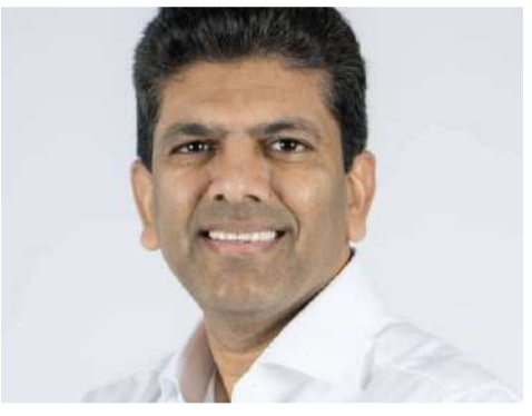
వార్త వేకువ, అమరావతి, జూన్ 10 : తక్కువ జనాభా ఉన్నప్పటికీ, కేంద్ర ప్రభుత్వం నుంచి నిధులు పొందుతున్న రాష్ట్రాల్లో ఆంధ్రప్రదేశ్ మూడో స్థానంలో నిలిచింది కేంద్ర గ్రామీణాభివృద్ధి, కమ్యూనికేషన్ల శాఖ సహాయ మంత్రి పెమ్మసాని చంద్రశేఖర్ తెలిపారు. బుధవారం ఢిల్లీలో మీడియా ప్రతినిధులతో - మిగతా 2 లో