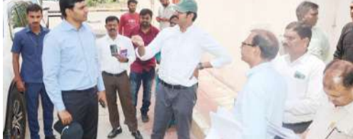
సంక్షేమ పథకాల లక్ష్యాన్ని సాకారం చేయాలంటే లబ్ధిదారులు గృహాల్లో నివసించాలని అన్నారు. వేలాది మంది పేదల ఇళ్ల కోసం ఎదురుచూస్తున్న నేపథ్యంలో కేటాయించిన గృహాలను వినియోగించని వారి కేటాయింపులను రద్దు చేసి అర్హులైన ఇతరులకు అవకాశం కల్పిస్తామని స్పష్టం చేశారు. అలాగే దుండిగల్ ఫేజ్-2 కాలనీలో కొనసాగుతున్న నిర్మాణ పనులను పరిశీలించిన ఆయన, మిగిలిన పనులను త్వరితగతిన పూర్తి చేయాలని కాంట్రాక్టర్లను ఆదేశించారు. ముఖ్యంగా రహదారులు, తాగునీరు, విద్యుత్ తదితర మౌలిక సదుపాయాల కల్పనపై ప్రత్యేక శ్రద్ధ వహించాలని