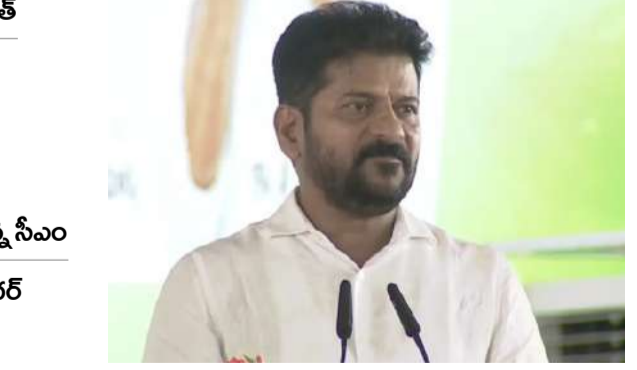
వార్త వేకువ, హైదరాబాద్, జూన్ 10 : తెలంగాణ చరిత్రలో ఒక సరికొత్త మైలురాయి లిఖించబడబోతోంది. హైదరాబాద్ ఖ్యాతిని ప్రపంచస్థాయికి తీసుకెళ్లే 'భారత్ ప్యూచర్ సిటీ' కల సాకారమయ్యేందుకు తొలి అడుగు పడింది. ఎంతో ప్రతిష్టాత్మకంగా భావిస్తున్న ప్యూచర్ సిటీ డెవలప్ మెంట్ అథారిటీ ప్రధాన కార్యాలయాన్ని ముఖ్యమంత్రి రేవంత్ రెడ్డి ఈ రోజు సాయంత్రం ఆధికారికంగా ప్రారంభించనున్నారు. ఈ భవన ప్రారంభోత్సవం అనంతరం అక్కడ ఏర్పాటు చేసిన భారీ బహిరంగ సభలో సీఎం ప్రసంగించనున్నారు. ఈ చారిత్రాత్మక సందర్భంపై ముఖ్యమంత్రి రేవంత్ రెడ్డి స్పందిస్తూ.. "ఇది చరిత్రలో నిలిచిపోయే రోజు. ఆధునిక భారతదేశానికి