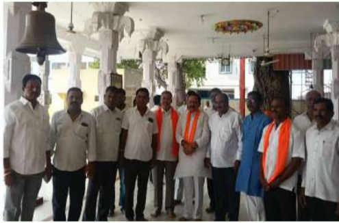
డిజిటల్ విప్లవం: జన్ ధన్ యోజన ద్వారా పేదలకు ఆర్థిక సమృద్ధితం, డిజిటల్ ఇండియా మరియు యూపీబ ద్వారా ప్రపంచంలోనే అగ్రగామిగా డిజిటల్ చెల్లింపుల వ్యవస్థ ప్రజా సంక్షేమం: ఆయుష్మాన్ భారత్ ద్వారా కోట్లాది మందికి ఉచిత ఆరోగ్య భద్రత, పీఎం అవాస యోజన ద్వారా సొంతంటి కల, జిల్ల జీవన్ మిషన్ ద్వారా ప్రతి ఇంటికి స్వచ్ఛమైన తాగునీరు. చారిత్రాత్మక నిర్ణయాలు: జీఎస్టీ అమలు, నూతన విద్యా విధానం, మరియు దేశ