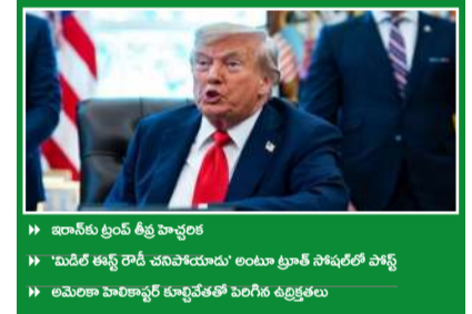
▶▶ డాన్లూ ట్రంప్ తీవ్ర హెచ్చరిక ▶▶ "మీదేశ భద్రతాకాంక్షలను అణగారిన డెటెనాల్స్ భద్రత ▶▶ అమెరికా వారిలాగే డెటెనాల్స్ భద్రతను అణగారిన