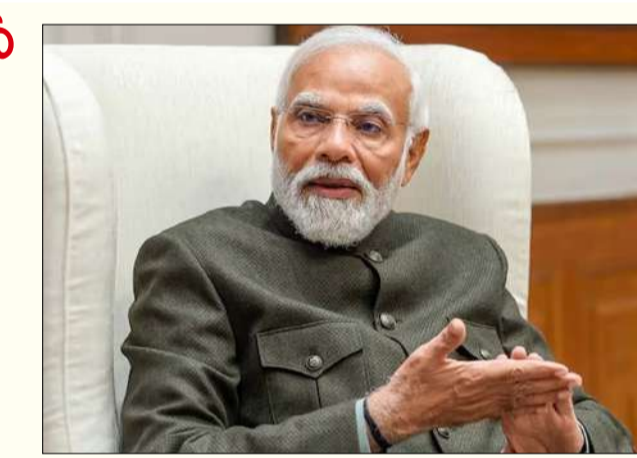
తొలిసారిగా ప్రధానిగా బాధ్యతలు చేపట్టారు. అనంతరం 2019లో రెండోసారి, 2024 జూన్ 9న సరికొత్త ప్రభుత్వ సారథిగా మూడోసారి పగ్గాలు చేపట్టారు. మోదీ నాయకత్వంలో పేదరిక నిర్మూలన, సామాజిక సాధికారత, ఆర్థికత 370 రద్దు, నక్షత్రాల అణచివేత, సరిహద్దుల బలోపేతం వంటి కీలక రంగాల్లో దేశం గణనీయమైన పురోగతి సాధించింది రామచంద్రరావు వివరించారు. మరోవైపు, ప్రధాని మోదీ - మిగతా 2 లో