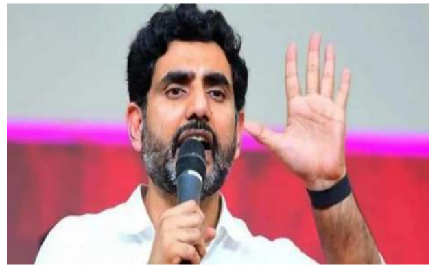
కోల్పోయినట్లు అధికారులు ద్రువీకరించారు. దీంతో ప్లాంట్లో విషాద ఛాయలు అలముకున్నాయి. మరోవైపు ప్రభుత్వం ప్రకటించిన సహాయక చర్యలు వేగంగా అమలువుతున్నాయి. మంగళవారం డిప్యూటీ సీఎం పవన్ కల్యాణ్, బిటీ శాఖ మంత్రి నారా లోకేశ్ బాధితు కుటుంబాలను పరామర్శించి, ఇచ్చిన మాట ప్రకారం 24 గంటలు - మిగతా 2 లో