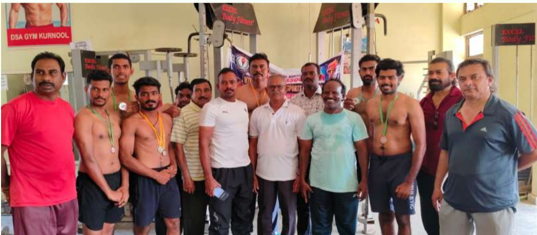
పోటీల తరువాత: జూన్ 17: హ్యాండ్ బాల్ జూన్ 18: అథ్లెటిక్స్, మోడరన్ పెంట్ బాల్ (రన్ - మాట్ - రన్) జూన్ 20: క్రోసాట్, వాలీబాల్, సాక్స్ బాల్, స్పెర్టింగ్, సాక్స్ టెన్నిస్, జూడ్ జూన్ 21: బాస్కెట్ బాల్, ఉప, మాస్టర్స్ అథ్లెటిక్స్, ట్రైడిప్లెట్ ఆర్ట్స్, టెన్నిస్, వాటర్ స్పోర్ట్స్ జూన్ 22: యోగా, బేస్ బాల్.