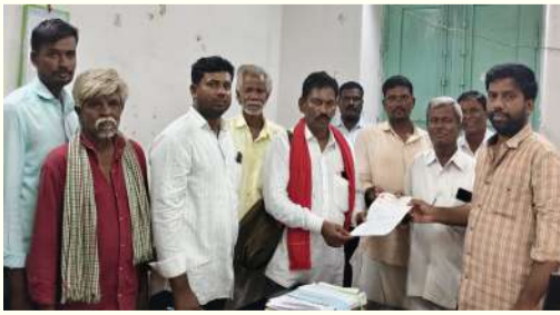
వివరీతంగా పెంచారని ఆయన ఆవేదన వ్యక్తం చేశారు అన్ని పంటలకు మద్దతు ధర ప్రకటించాలని డిమాండ్ చేశారు రివెన్యూ