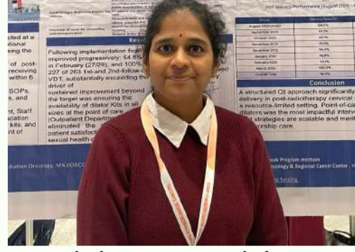
అందుబాటులో లేకపోవడం వల్ల గతంలో దీని వినియోగం శూన్యంగా ఉండేది.

గర్భాశయ ముఖద్వార క్యాన్సర్ రేడియోథెరపీ చికిత్స అందించిన తర్వాత చాలా మంది మహిళల్లో 'వెజెనల్ స్ట్రెస్' అనే దీర్ఘకాలిక దుస్వప్నం కనిపిస్తుంది. ఇది మహిళల్లో తీవ్రమైన శారీరక, మానసిక వేదనకు మరియు లైంగిక సమస్యలకు దారితీస్తుంది. ఈ సమస్య నివారణకు 'వెజెనల్ డ్రైలెట్ థెరపీ' అత్యంత అవసరమైనప్పటికీ, అవగాహన లోపం, సామాజిక అడ్డంకులు మరియు ప్రభుత్వ అసమర్థతల వల్ల డ్రైలెట్ కిట్లు