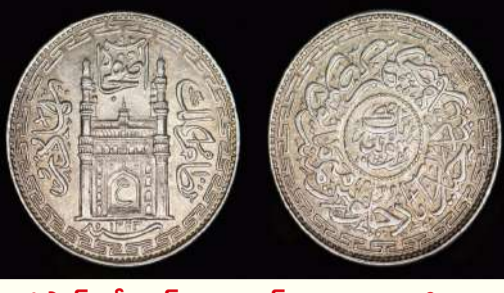
ఉస్మాన్ అలీ ఖాన్, హైదరాబాద్ నిజాం 1343 హిజరీ