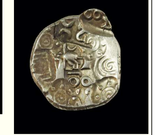
ప్రతాప రుద్ర, రాయ గజ కేసరి, కాకతీయ రాజవంశం