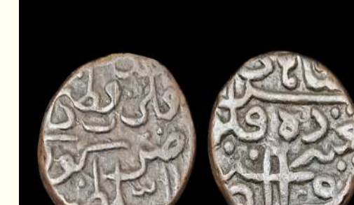
కులీ కుతుబ్ షా, గోల్కొండ రాజవంశం