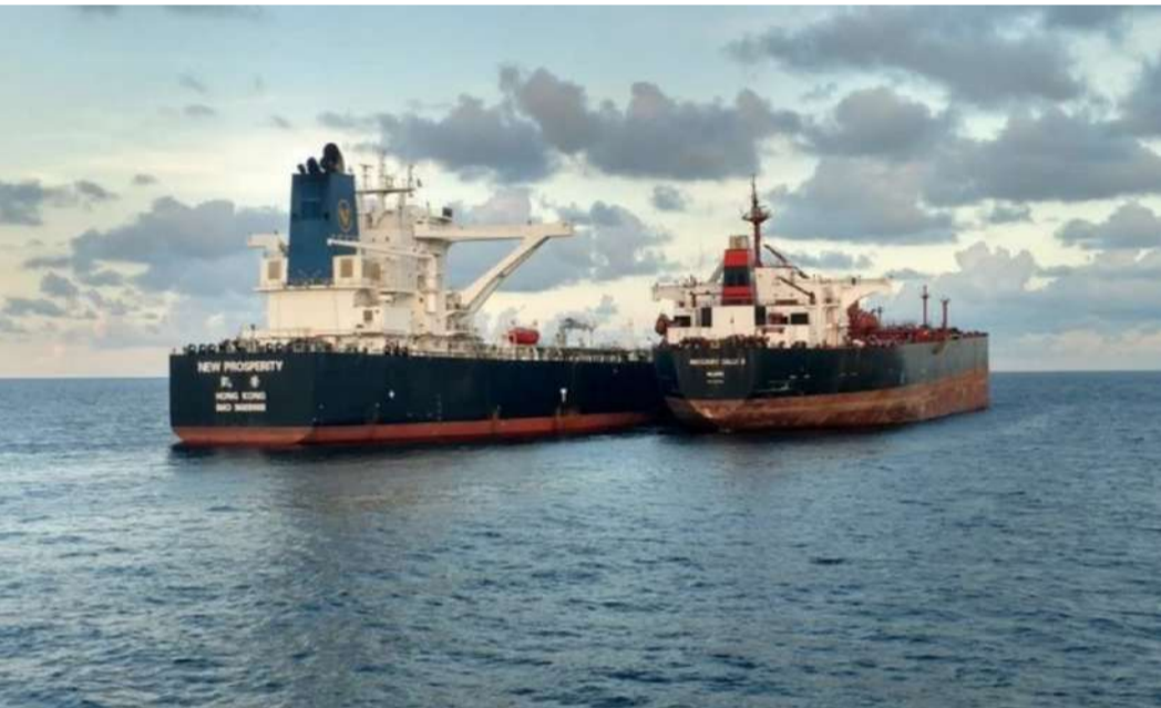
అమెరికా నుంచి మరీ ఇలా ఏంటి

అమెరికా - ఇరాన్ మధ్య శాంతి ఒప్పందం కుదిరిన నేపథ్యంలో హర్యాణా జలసంధి పూర్తి స్థాయిలో తిరిగి తెరుచుకుంటోంది. దీంతో ఇప్పటికే గల్ఫ్ దేశాల నుంచి చమురు సరఫరా జరుగుతోంది. చమురు రవాణాకు ప్రపంచవ్యాప్తంగా హర్యాణా జలసంధి కీలకంగా ఉంది. ఈ క్రమంలోనే హర్యాణా పూర్తి స్థాయిలో సాధారణ స్థితికి వచ్చే లోపే భారత్ చమురు సరఫరాను భారీగా పెంచుతోంది. తన ఇంధన భద్రతను మరింత బలోపేతం చేసుకునే దిశగా అదుగులు వేస్తోంది. జూన్ నెలలో రష్యా, యునైటెడ్ అరబ్ ఎమిరేట్స్ (ఊబీఈ) నుంచి క్రూడ్ అయిల్ కొనుగోళ్లను గణనీయంగా పెంచినట్లు తాజా గణాంకాలు వెల్లడించాయి. గల్ఫ్ ప్రాంతంలో సరఫరా అంతరాయాల నేపథ్యంలో భారత్ రిఫైనరీలు ముందస్తు జాగ్రత్త చర్యలు చేపట్టినట్లు విశ్లేషకులు చెబుతున్నారు. మార్చి 2025 అండ్ కమిటీ ఇంటిలిజెన్స్ సంస్థ కెప్టర్ ఈ గణాంకాల్ని వెల్లడించింది. జూన్ 1 నుంచి 19 వరకు భారత్ రోజుకు సగటున 26.6 లక్షల బ్యారెళ్ల రష్యా క్రూడ్ అయిల్ దిగుమతి చేసుకుంది. మే నెలలో ఇది కేవలం 19.1 లక్షల బ్యారెళ్లకే ఉంది. జూన్లో ఈ లెక్కను భారీ స్థాయిలో పెరిగించిన వెబ్సైట్లు, దీంతో రష్యా మరోసారి భారతదేశానికి అతిపెద్ద చమురు సరఫరాదారుగా నిలిచింది. యూపీఈ నుంచి కూడా భారత్ రోజుకు 6.36 లక్షల బ్యారెళ్ల చమురును దిగుమతి చేసుకుంది. మే నెలలో ఇక్కడ రికార్డు స్థాయిలో 6.44 లక్షల బ్యారెళ్లగా ఉండగా ఇక్కడ కాస్త తగ్గిందని వెబ్సైట్లు, అయితే ప్రస్తుత పరిస్థితుల్లో ఇది ఎక్కువైన తెలుస్తోంది. ఇక వెనెజువెలా నుంచి రోజుకు 2.09 లక్షల బ్యారెళ్ల మొదటి చమురు దిగుమతి కావడంతో ఈ దేశం భారత్కు నాలుగో అతిపెద్ద చమురు సరఫరాదారుగా అవతరించింది. సౌదీ అరేబియా రోజుకు 3.84 లక్షల బ్యారెళ్ల చమురును భారత్కు ఎగుమతి చేసే మూడో స్థానంలో ఉంది.