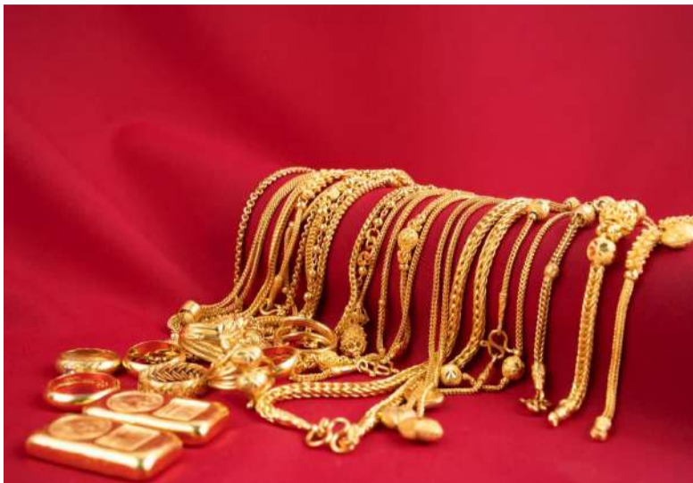
వల్ల దీనితో నేరుగా ఆభరణాలను తయారు చేయలేరు. అందుకే దీనిని బంగారు నాణేలు, బిస్కెట్లు మరియు బార్ల రూపంలో పెట్టుబడులు కోసం ఉపయోగిస్తారు.

916 హోల్మార్క్డ్ ప్రాధాన్యం : హోల్మార్క్డ్ అనేది బంగారం స్వచ్ఛతను ప్రభుత్వ పరంగా లభించే అధికారిక గ్యారంటీ. 22 క్యారెట్ల గుర్తు: మార్కెట్లో '916 హోల్మార్క్డ్' ఉన్న బంగారాన్ని 22 క్యారెట్ల నాణ్యమైన ఆభరణంగా గుర్తిస్తారు. భవిష్యత్తు ప్రయోజనం : హోల్మార్క్డ్ నగలను కొనుగోలు చేయడం వల్ల మోసపోయే అవకాశం ఉండదు. అలాగే, భవిష్యత్తులో వాటిని తిరిగి విక్రయించినప్పుడు కూడా మంచి రేస్ట్ విలువ లభిస్తుంది. బంగారం స్వచ్ఛతను ఎలా లెక్కిస్తారు: బంగారం నాణ్యతను క్యారెట్లలో కొలుస్తారు. క్యారెట్ విలువ పెరిగేకొద్దీ స్వచ్ఛత పెరుగుతుంది. 24 క్యారెట్ల బంగారం : ఇది 99.9% అత్యంత స్వచ్ఛమైన బంగారం. అయితే, ఇది చాలా మెత్తగా ఉండటం