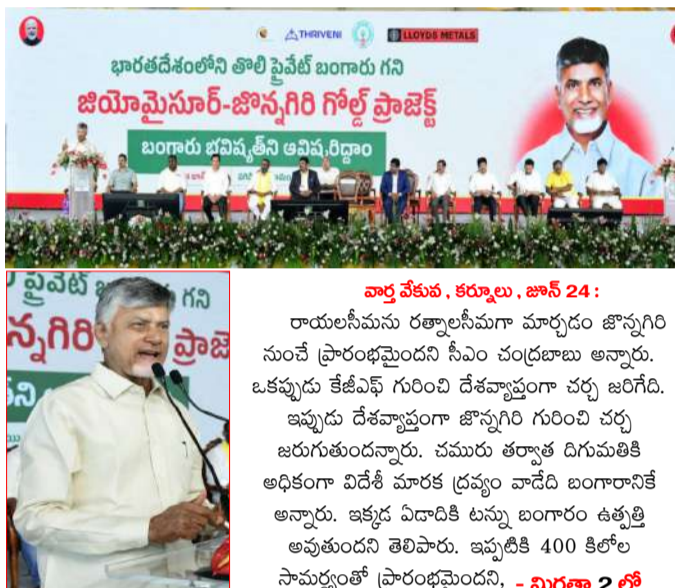
భారతదేశంలోని తొలి ప్రైవేట్ బంగారు గని జియోమైన్సూర్-జిన్నగిరి గోల్డ్ ప్రాజెక్ట్ బంగారు బహిష్కృత ఆవిష్కరణ