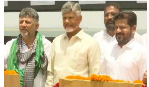
గోదావరి-కావేరి నదులను అనుసంధానించడం ద్వారా కర్ణాటక, ఏపీ, తమిళనాడు, తెలంగాణ రాష్ట్రాల ప్రయోజనాలు నెరవేరతాయని సూచించారు. ఈ విధాని ఎల్ నివో కారణంగా తుంగభద్ర, అలకృష్ణి జలాశయాలుకు ఎగువ నుంచి నీటి ప్రవాహాలు తగ్గిపోయాయని, అందుకే నీటిని చాలా పొదుపుగా వాడుకోవాల్సి అవసరం ఉందని