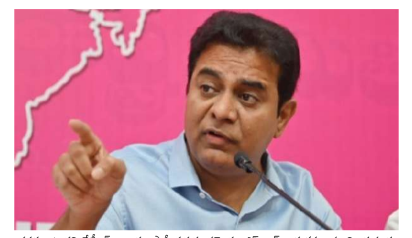
అవసరం ఉందని కేటీఆర్ అన్నారు. పార్టీ సభ్యత్వం నమోదు, ఎన్ఐఆర్ కార్యక్రమాలను విజయవంతం చేయాలని కార్యకర్తలకు పిలుపుచ్చారు.

మొదటిపేజీ తరువాయి - అదే రంగాన్ని పూర్తిగా దెబ్బతీశారని విమర్శించారు. చేవెళ్ల నియోజకవర్గంలో నిర్వహించిన పార్టీ కార్యక్రమ సమావేశం, ఎన్ఐఆర్ శిక్షణ కార్యక్రమంలో పాల్గొన్నారు. కాంగ్రెస్ ప్రభుత్వంపై తీవ్ర స్థాయిలో విమర్శలు గుప్పించారు. ఎన్నికలకు ముందు రూ.కోటి పలికిన ఎకరం భూమి ప్రస్తుతం రూ.50-60 లక్షలకు కూడా కొనుగోలుదారులు దొరకని పరిస్థితి ఏర్పడిందన్నారు. రియల్ ఎస్టేట్లో ఆధారపడి జీవిస్తున్న లక్షలాది మంది ఉపాధి కోల్పోయే పరిస్థితి వచ్చిందని ఆరోపించారు. కేటీఆర్ హయాంలో చేవెళ్ల ప్రాంత అభివృద్ధికి ప్రత్యేక ప్రాధాన్యం ఇచ్చామని కేటీఆర్ చెప్పారు. షాడో వసరం ప్రాంతాల్లో పారిశ్రామిక పార్కులు ఏర్పాటు చేసి మైక్రోసెక్టర్లు, అమెజాన్, వెల్సెస్ వంటి అంతర్జాతీయ సంస్థలను తీసుకొచ్చామని చెప్పారు. పరిశ్రమల విస్తరణతో ఒక్కమూ రూ.30 లక్షలు ఉన్న ఎకరం భూమి విలువ రూ.3 కోట్లకు చేరిందన్నారు. ఇప్పుడు ఆ పరిస్థితి పూర్తిగా మారిపోయిందన్నారు. కాంగ్రెస్ ప్రభుత్వం అధికారంలోకి వచ్చి రెండున్నరేళ్ల గడిచినా ఎన్నికల హామీల్లో ఒక్కటి కూడా పూర్తిగా అమలు కాలేదని కేటీఆర్ విమర్శించారు. రైతు బంధు, దళిత బంధు, ఇందిరమ్మ ఇళ్లు, అసైన్డ్ భూమిల పట్టణ అంతాల్లో ప్రజలను మోసం చేశారని ఆరోపించారు. రైతులు తీవ్ర ఇబ్బందులు పడుతున్నారని అన్నారు. రాష్ట్రంలో అవినీతి, అక్రమాల పెరిగిపోయాయని కేటీఆర్ ఆరోపించారు. గత ప్రభుత్వం అప్పులపై విమర్శలు చేసే కాంగ్రెస్ నేతలకు తమ పాలనలో చేసిన అప్పుల ప్రజలకు చెప్పాలని డిమాండ్ చేశారు. బీఆర్ఎస్ ప్రభుత్వం చేసిన అప్పులు అభివృద్ధి, సంక్షేమ కార్యక్రమాల కోసమే ఖర్చయ్యాయని చెప్పారు. తెలంగాణ అభివృద్ధి, సంక్షేమం కొనసాగాలంటే 2028లో కేటీఆర్ మళ్లీ ముఖ్యమంత్రి కావాల్సి