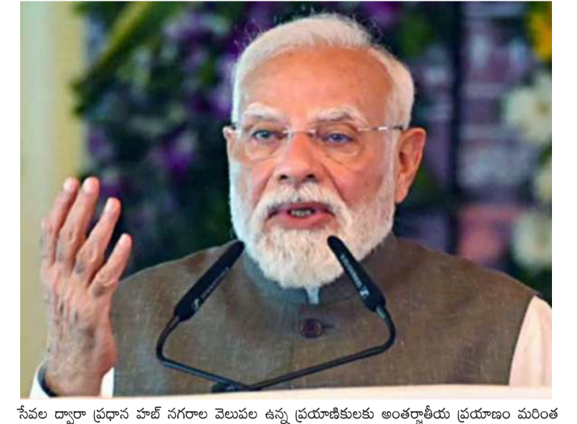
సేవల ద్వారా ప్రధాన హాట్ నగరాల వెలుపల ఉన్న ప్రయాణికులకు అంతర్జాతీయ ప్రయాణం మరింత సులభం కానుంది. ప్రపంచంలోనే వేగంగా ఎదుగుతున్న విమానయాన మార్కెట్లో భారత్ ఒకటి. ఈ నేపథ్యంలో చిన్న నగరాలను అంతర్జాతీయ గమ్యస్థానాలతో అనుసంధానం చేయడం ద్వారా దేశాన్ని ప్రపంచ విమానయాన కేంద్రంగా తీర్చిదిద్దాలని కేంద్ర ప్రభుత్వం లక్ష్యంగా పెట్టుకుంది. చిన్న నగరాల అభివృద్ధికి దోహదం పౌర విమానయాన శాఖ కార్యదర్శి సుమీర్ కుమార్ సిన్హా మాట్లాడుతూ, ఈ మోడల్ రెండో, మూడో శ్రేణి నగరాలకు ఎంతో ప్రయోజనం చేకూరుస్తుందని చెప్పారు. మెరుగైన అంతర్జాతీయ అనుసంధానం వల్ల కొత్త పెట్టుబడులు ఆకర్షించడంతో పాటు ఉపాధి అవకాశాలు కూడా పెరుగుతాయని హేర్బాన్యారు. వాణిజ్యం, పర్యాటకం, విద్య, వైద్య రంగాలకు కూడా ఈ మోడల్ ఊతమిస్తుందని ఆయన అభిప్రాయపడ్డారు.

మొదటిపేజీ తరువాయి - ప్రపంచ స్థాయి అనుసంధానం లభిస్తుందని హేర్బాన్యారు. 'విమానాశ్రయాలపై ఒత్తిడి తగ్గుతుంది' ఈ మోడల్ వల్ల ఇప్పటికే ఉన్న మౌలిక సదుపాయాలను మరింత సమర్థంగా వినియోగించుకునే అవకాశం ఉంటుందని ప్రధాని మోదీ చెప్పారు. విమానాల వినియోగ సామర్థ్యం పెరగడంతో పాటు, ప్రధాన విమానాశ్రయాలపై ఉన్న రద్దీ కూడా తగ్గుతుందని హేర్బాన్యారు. అత్యంత ముఖ్యంగా, దేశంలోని మరిన్ని ప్రాంతాలను ప్రపంచ అవకాశాలకు దగ్గర చేస్తుందని ప్రధాని తన సందేశంలో హేర్బాన్యారు. ఈ కొత్త మోడల్ కింద తొలి సేవలు ప్రారంభమైన వారణాసికి ప్రత్యేక గుర్తింపు ఉందని తెలిపారు. ప్రపంచంలోనే అత్యంత పురాతన జీవన నగరాల్లో ఒకటైన వారణాసి భారతీయ నాగరికతకు ప్రతీక అని హేర్బాన్యారు. అభివృద్ధి, వారసత్వం రెండింటినీ సమన్వయం చేస్తూ ముందుకు సాగాలన్న తమ దృక్పథానికి వారణాసి ప్రతిబింబమని చెప్పారు. మెరుగైన విమాన అనుసంధానం ద్వారా ఈ నగరం ప్రపంచంతో మరింత బలమైన సంబంధాలను ఏర్పరుచుకుంటూనే తన ప్రత్యేకతను కాపాడుకుంటుందని హేర్బాన్యారు. 'ఈజీ కనెక్ట్' పేరుతో తొలి సేవలు ఎయిర్ఇండియా 'ఈజీ కనెక్ట్' పేరుతో ఈ ప్రత్యేక సేవలను అందుబాటులోకి తీసుకొచ్చింది. తొలి విమానం ఏబి1111 ఉదయం 9.30 గంటలకు వారణాసి నుంచి బయలుదేరింది. ఈ విమానం ద్వారా దిల్లీకి చేరుకున్న ప్రయాణికులు అక్కడి నుంచి దుబాయి, కొలంబో, జెడ్డా, రియద్, ఫుజైర్ సహా కొన్నింటి అంతర్జాతీయ గమ్యస్థానాలకు ప్రయాణించే అవకాశం కల్గించారు. ఈ మోడల్ ద్వారా చిన్న నగరాల నుంచి వచ్చే ప్రయాణికులు ముందుగా దిల్లీ వంటి ప్రధాన హాట్ విమానాశ్రయాలకు చేరుకుని, అక్కడి నుంచి విదేశీ గమ్యస్థానాలకు సులభంగా వెళ్లగలుగుతారు.